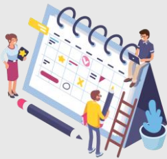
Jaarplanning & Nieuwsbrieven